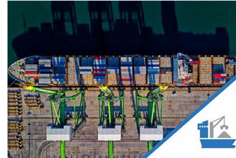
Порти та термінали