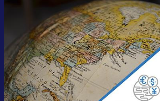
Legal support of FEA