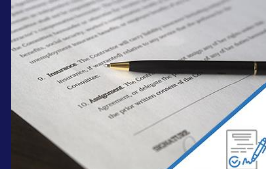
Business sale & purchase