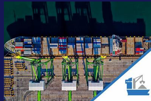
Ports and terminals